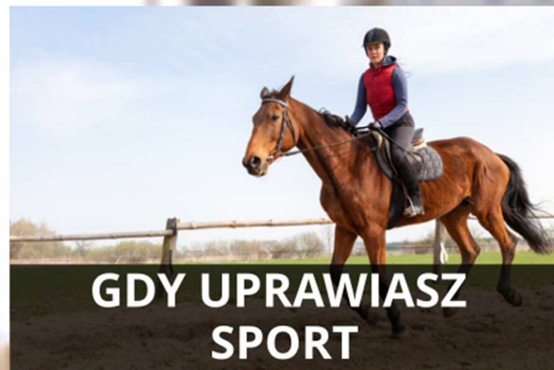
GDY UPRAWIASZ SPORT